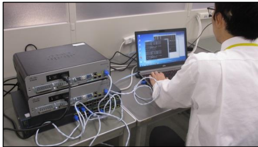
ネットワーク演習