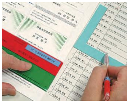
L字定規・定規を活用した対応法